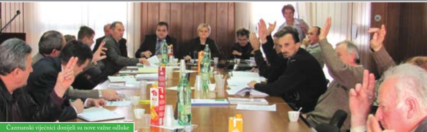
Čazmanski vijećnici donijeli su nove važne odluke