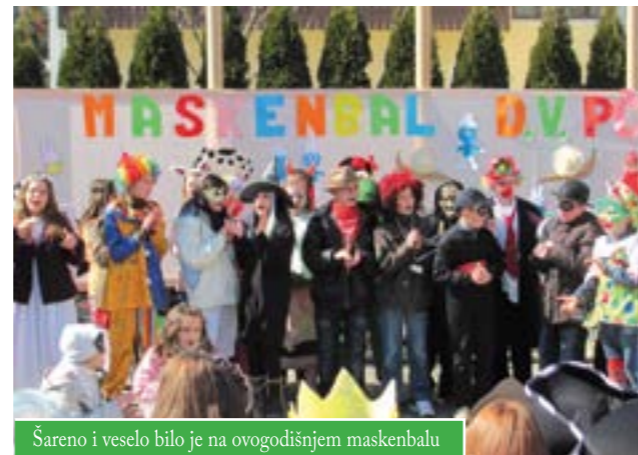
Šareno i veselo bilo je na ovogodišnjem maskenbalu

Bila je to najveća maškarana povorka u Čazmi unatrag nekoliko godina, a djeci, koja su održala i zabavni program, pridružili su se i članovi Motokluba iz Bjelovara. Oni su i lani sudjelovali u maskenbalu čazmanskih vrtićanaca za koje su, baš kao i ove godine, osigurali krafne i topli čaj.