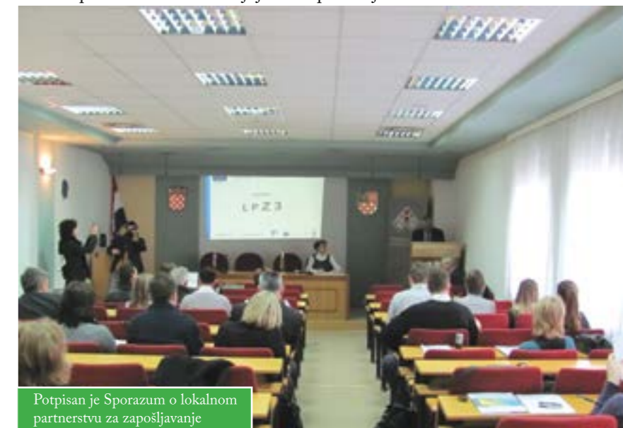
Potpisan je Sporazum o lokalnom partnerstvu za zapošljavanje

Bjelovarsko-bilogorska županija postala je jedna od prvih županija u Hrvatskoj u kojoj je osnovano Lokalno partnerstvo za zapošljavanje. Lokalno partnerstvo za zapošljavanje – faza 3, projekt je koji se financira u sklopu IV. komponente IPA – Razvoj ljudskih potencijala.