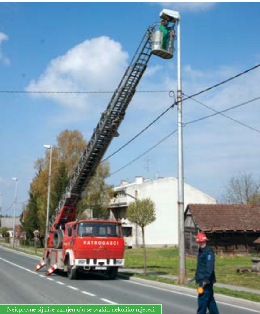
Neispravne sijalice zamjenjuju se svakih nekoliko mjeseci

Početkom godine zamijenjeno je 50-ak dotrajalih sijalica javne rasvjete u više od 15 prigradskih naselja, a dok ovo pišemo priprema se nova izmjena. Radove izvode djelatnici Komunalija uz pomoć čazmanske JVP i to svakih nekoliko mjeseci, prema ukazanoj potrebi. Održavanje javne rasvjete financira se iz gradskoga proračuna, za što se godišnje izdvaja oko 100.000 kuna.