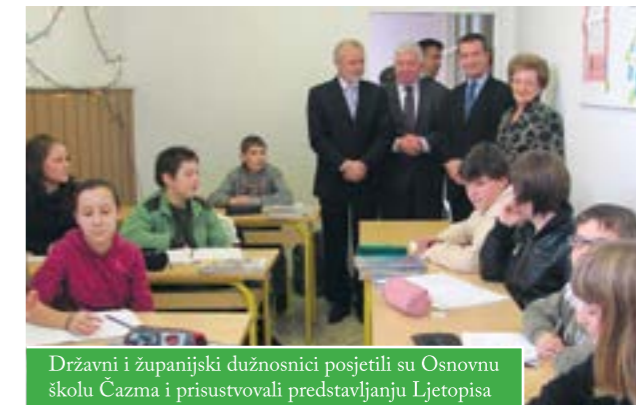
Državni i županijski dužnosnici posjetili su Osnovnu školu Čazma i prisustvovali predstavljaju Ljetopisa

Osnovna škola Čazma izradila je ljetopis o impresivnih 780 godina školstva u našem gradu. Uz predstavnike Grada Čazme i Bjelovarsko-bilogorske županije, gradonačelnika Dinka Piraka i župana Miroslava Čačića sa suradnicima, njegovu predstavljaju prisustvovali su: izaslanik ministra znanosti obrazovanja i športa, državni tajnik, Želimir Jančić te ravnatelj Agencije za odgoj i obrazovanje, Vinko Filipović.