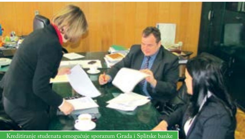
Kreditiranje studenata omogućuje sporazum Grada i Splitske banke

U Gradu Čazmi potpisan je Ugovor o suradnji sa Splitskom bankom koja je na javnom pozivu Grada Čazme izabrana kao najpovoljniji ponuđač studentskih kredita.