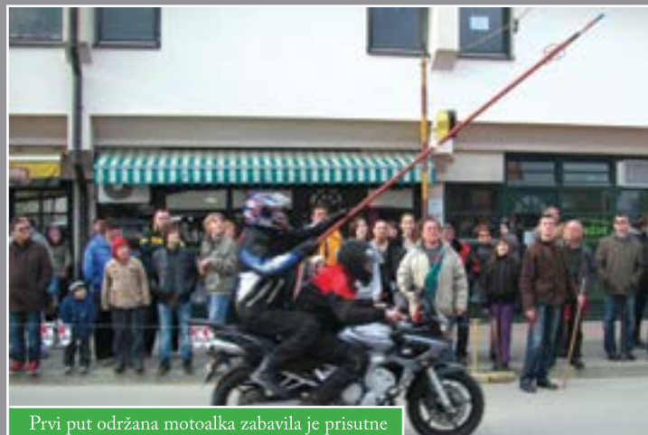
Prvi put održana motoalka zabavila je prisutne

osigurali su dobru kapljicu. Po proglašenju najboljih maratonaca i maratonki, bogat program u Čazmi upotpunila je i prvi put održana moto-alka čije je održavanje potaknuo Motoklub Bjelovar.