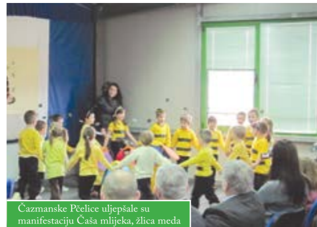
Čazmanske Pčelice uljepšale su manifestaciju Čaša mlijeka, žlica meda

Predstavnici Bjelovarsko-bilogorske županije i Pčelarskog saveza BBŽ predstavili su projekt „Čaša mlijeka, žlica meda“, kojim se osnovnoškolcima i vrtićancima skreće pozornost na zdravu prehranu.