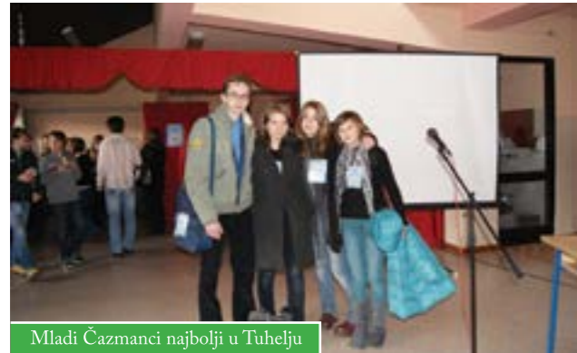
Mladi Čazmanci najbolji u Tuhelju

Projekt Dječjeg vijeća Čazme odabran je kao najbolji na 6. susretu Dječjih vijeća Hrvatske, na kojemu su sudjelovali među 15 aktivnih Dječjih vijeća iz cijele Hrvatske.