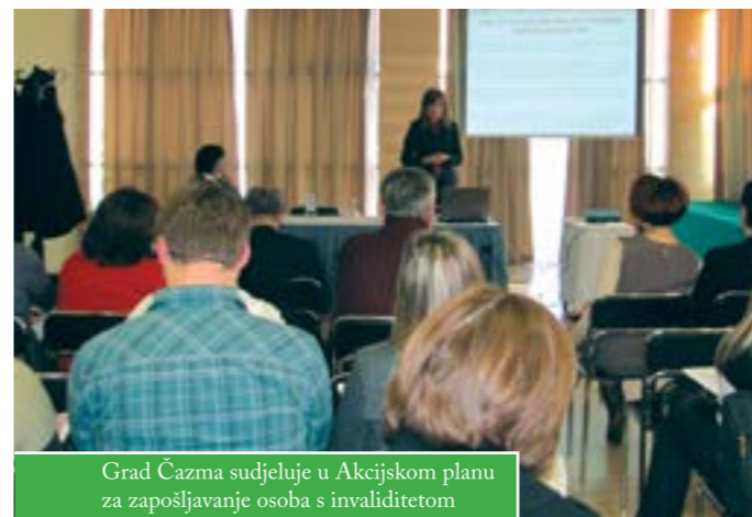
Grad Čazma sudjeluje u Akcijskom planu za zapošljavanje osoba s invaliditetom

U okviru projekta IPA 2007-2009 „Poticanje intenzivnijeg uključivanja osoba s invaliditetom na tržište rada“ čiji je korisnik Hrvatski zavod za zapošljavanje, Grad Čazma i Razvojna agencija Čazma imenovali su predstavnike radne skupine za izradu akcijskih planova za zapošljavanje osoba s invaliditetom.