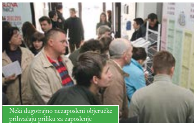
Neki dugotrajno nezaposleni obijuju priliku za zaposlenje

Predstavljen je projekt „Kompetencijama i partnerstvom protiv dugotrajne nezaposlenosti“, financiran iz IPA programa „Razvoj ljudskih potencijala“, u kojemu kao suradnici sudjeluju i Grad Čazma te Razvojna agencija Čazma. Organizator i nositelj je Hrvatski zavod za zapošljavanje. Projekt koji će biti proveden od siječnja 2011. do veljače 2012. vrijedan je oko 100.000 eura i sufinanciran nepovratnim sredstvima iz fondova predpristupne pomoći u iznosu od oko 80.000 eura.