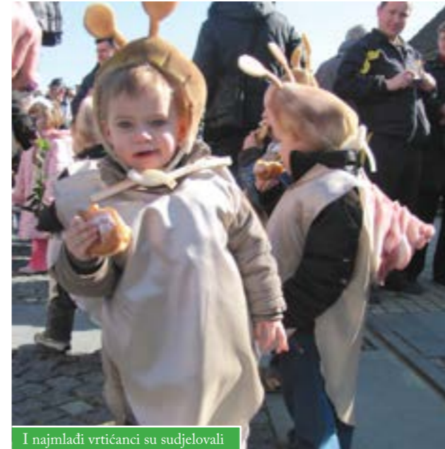
I najmlađi vrtićanci su sudjelovali

zaštićene robne marke „Zlatna nit“, koji su osigurali članovi županijskog Pčelarskog saveza.