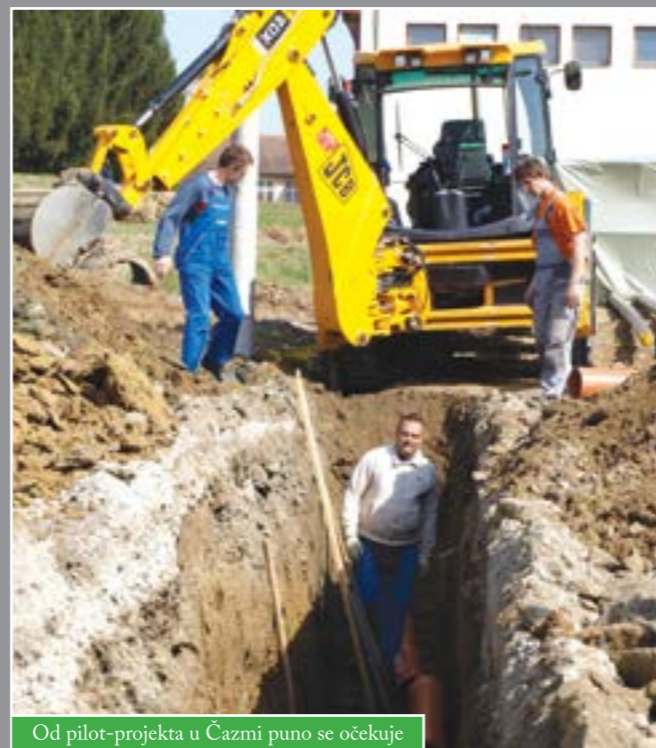
Od pilot-projekta u Čazmi puno se očekuje

Prema njegovim riječima, počela je izgradnja toplovoda od DI „Čazma“, koji bi do sljedeće školske godine energijom trebao opskrbljivati čazmansku Osnovnu i Srednju školu te sportsku dvoranu. Riječ je o pilot-projektu vrijednom 720.000 kn koji većim dijelom financira Fond za energetske učinkovitost te Bjelovarsko-bilogorska županija. U tijeku je i izrada projektne dokumentacije za dio gradskog područja koji bi također mogao