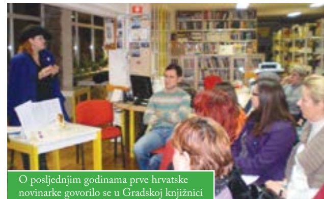
O posljednjim godinama prve hrvatske novinarkice govorilo se u Gradskoj knjižnici

U povodu rođendana Marije Jurić – Zagorke, najčitanije hrvatske književnice, prve hrvatske novinarkice i feministice, i Međunarodnog dana žena, čazmanska Gradska knjižnica organizirala je program čitanja Zagorkinih pisama.