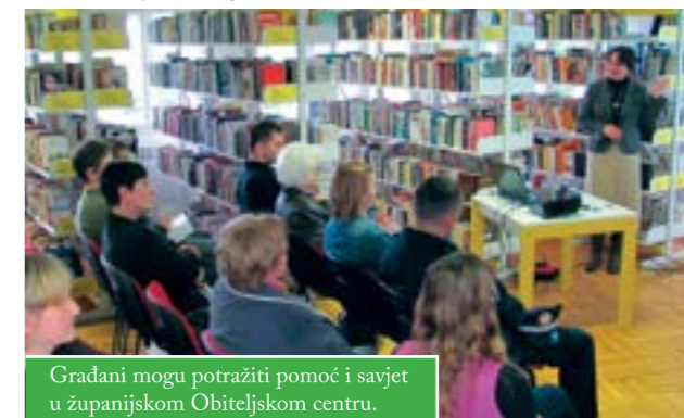
Gradani mogu potražiti pomoć i savjet u županijskom Obiteljskom centru.

Obiteljski centar planira uvesti i uredovni dan u Čazmi te će u budućnosti, jedanput na mjesec, svoje usluge pružati i u tom gradu. Do tada, Čazmanci i svi ostali zainteresirani mogu se obratiti u sjedište Centra u Bjelovaru. Radno vrijeme je od ponedjeljka do četvrtka od 7 do 20 sati te petkom od 7 do 16 sati. Adresa je Masarykova 8, pokraj autobusnog kolodvora, a broj telefona 043/277-060. Sve aktivnosti i usluge za korisnike su besplatne.