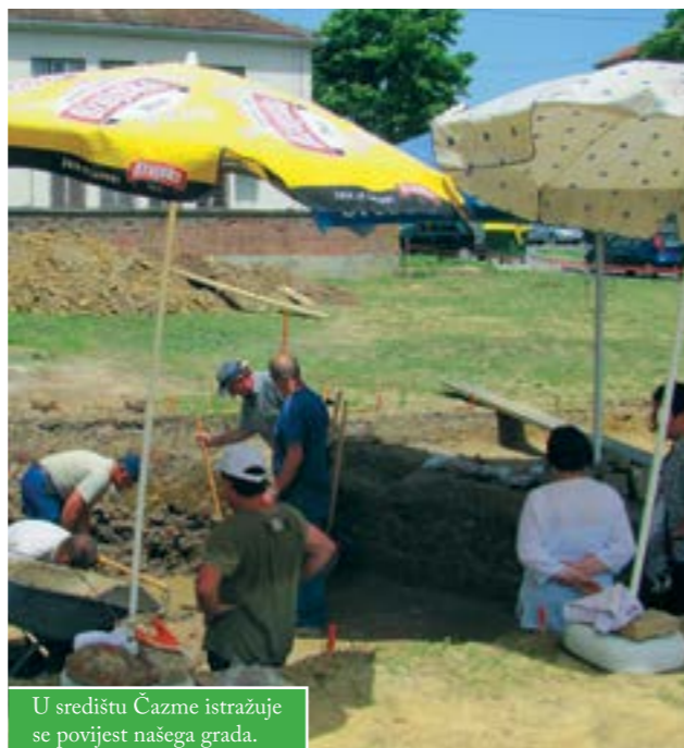
U središtu Čazme istražuje se povijest našega grada.

U Centru za kulturu tvrde kako je trenutačno najvažnije utvrditi postojanje antičkog naselja, na što i upućuje do sada otkrivena arhitektura. Prema riječima ravnateljice Centra za kulturu, Jadranke Kruljac – Sever, otkrije li se antičko naselje, morat će se detaljnije istražiti i konzervirati, a bude li zahtijevalo i restauraciju, radovi na budućem parkiralištu morat će pričekati.