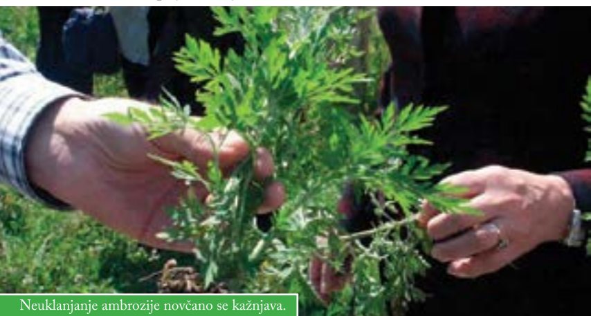
Neuklanjanje ambrozije novčano se kažnjava.

Na temelju Naredbe o poduzimanju mjera obveznog uklanjanja ambrozije, koju je donijelo Ministarstvo poljoprivrede, ribarstva i ruralnog razvoja, i Odluke o mjerama sprječavanja širenja i obvezi uklanjanja i uništavanja ambrozije na području BBŽ, koju je donijela Županijska skupština, podsjećaju se vlasnici i korisnici oranica, vrtova, livada, šuma, lovišta, kanala i drugog zemljišta na području Grada Čazme da su dužni provoditi mjere za uklanjanje ambrozije. Uklanjanje se provodi tokom cijele vegetacijske sezone, ali najveću pozornost treba usmjeriti na razdoblje prije cvatnje.