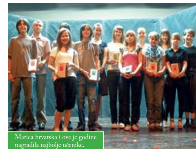
Matica hrvatska i ove je godine nagradila najbolje učenike.

Matica hrvatska, Ogranak Čazma, u suradnji s Centrom za kulturu, organizirala je „IX. susret s maturantima”, najboljim učenicima završnih razreda Osnovne i Srednje škole Čazma.