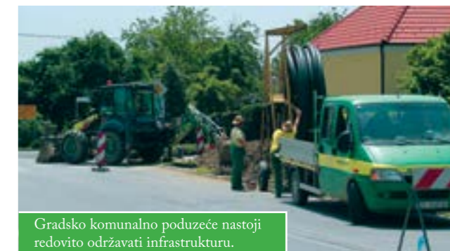
Gradsko komunalno poduzeće nastoji redovito održavati infrastrukturu.

Obnovljen je dio plinske mreže u Moslavačkoj i Ul. kralja Tomislava, u središtu Čazme. Time je u ovoj godini na čazmanskome području do sada zamijenjeno ukupno 1500 metara starih plinskih cijevi, a pripremaju se i radovi za plinovod u Derezi.