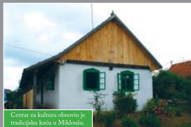
Centar za kulturu obnovio je tradicijsku kuću u Mikloušu.

Otvorena je obnovljena moslavačka tradicijska kuća u Mikloušu. Centar za kulturu, Gradski muzej Čazma, kupio je pokraj Crkve sv. Nikole u Mikloušu tipičnu staru kuću građenu od drvenih greda i pletera. Kuća je pročeljem okrenuta prema cesti i Crkvi. Sastoji se od tri prostorije u nizu te radionicom - kovačnicom okrenutom prema dvorištu. S prednje strane kuće je trijem. Od većih građevinskih radova sanirano je krovništvo, dimnjak, obijen je novi trijem i tavanski dio pročelja. Trijem, ostava i kovačnica su potaracani, sazidana je peć u kuhinji te peć za kovačnicu i postavljen je daščani pod.