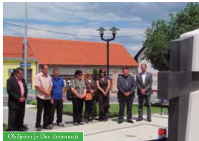
Obilježen je Dan državnosti.

U povodu Dana državnosti, delegacija Grada Čazme i predstavnici udruga proizašlih iz Domovinskog rata odali su počast poginulim braniteljima, polaganjem vijenca i paljenjem svijeća kod spomenika u gradskom parku.