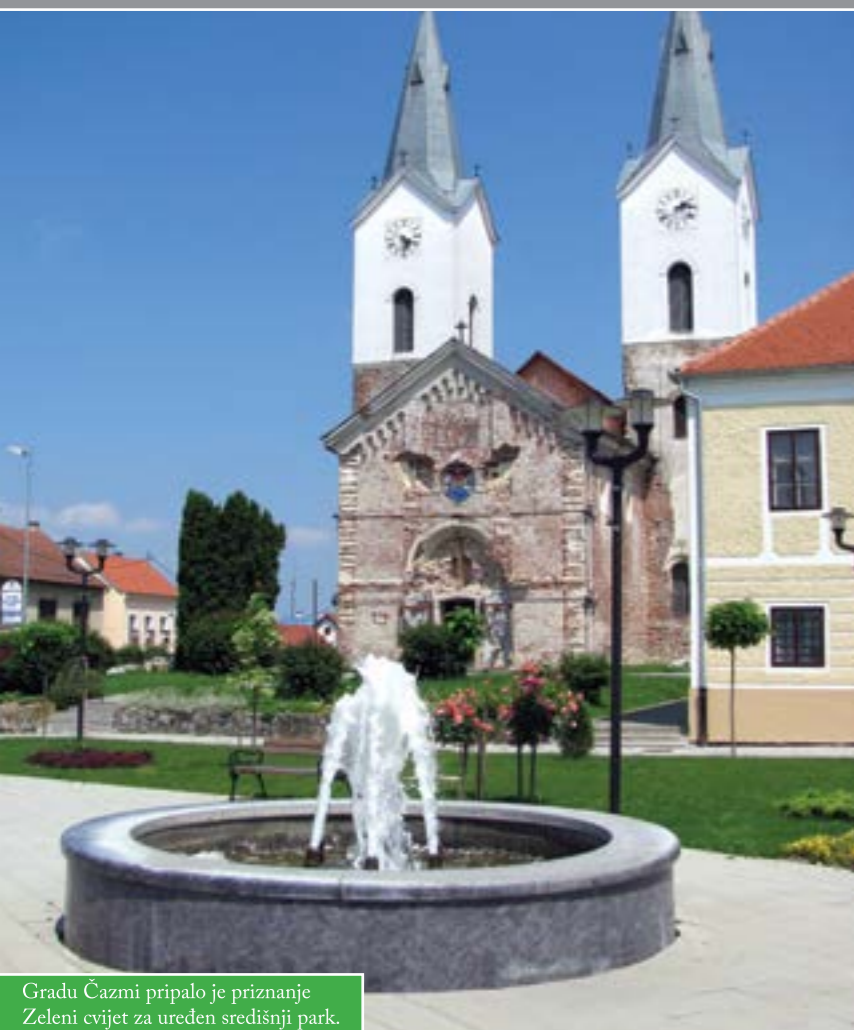
Gradu Čazmi pripalo je priznanje Zeleni cvijet za uređen središnji park.

Dodijeljena su priznanja „Zeleni cvijet“ najboljim promicateljima turizma Bjelovarsko-bilogorske županije. Organizatori su Turistička zajednica BBŽ i Grad Čazma, a manifestacija se prvi put održala na otvorenom, kod Mirjane i Franje Marinića, dobitnika nagrade za najuređeniju okućnicu u županiji. Među ostalima, za uređenost središnjega gradskoga parka, nagrađen je i Grad Čazma. Priznanja su dodijelili predstavnici Ministarstva turizma i Županije.