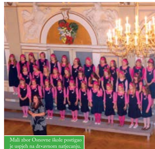
Mali zbor Osnovne škole postigao je uspjeh na državnom natjecanju.