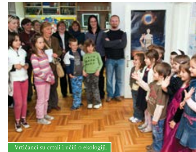
Vrtićanci su crtali i učili o ekologiji.

U Gradskoj knjižnici Slavka Kolara, u suradnji s Turističkom zajednicom Čazme, održana je izložba dječjih radova na temu „Više cvijeća, manje smeća“.