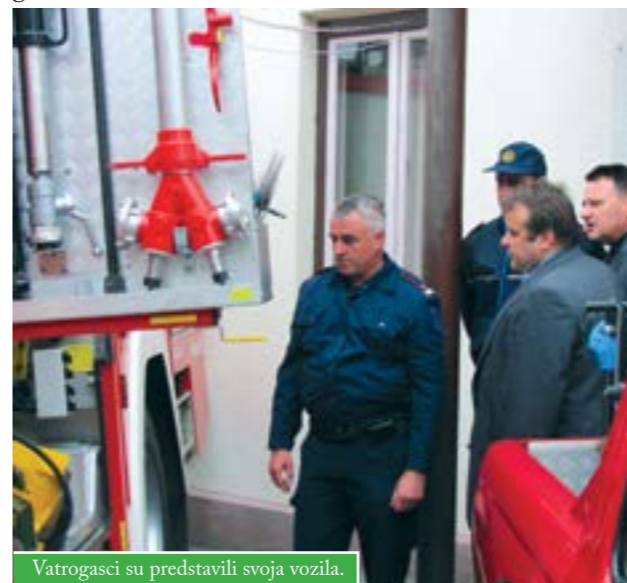
Vatrogasci su predstavili svoja vozila.

U organizaciji Vatrogasne zajednice Grada Čazme predstavljena su vozila i oprema Dobrovoljnog vatrogasnog društva Čazma i Javne vatrogasne postrojbe Grada Čazme te ponuda tvrtke koja prodaje vatrogasnu opremu. Vatrogasci su prvi prilikom požara, kemijskih nesreća, elementarnih nepogoda i sličnih izvanrednih situacija u kojima je ugrožen život, zdravlje i imovina. Operativna usklađenost s dobrovoljnim vatrogastvom garancija je pravovremene, primjerene i visokokvalitetne zaštite od požara. Pored zapovjednika i predsjednika DVD-a s područja Grada Čazme, prezentaciji su prisustvovali predstavnici vatrogasnih zajednica susjednih općina i gradova te gradonačelnik Dinko Pirak sa suradnicima.