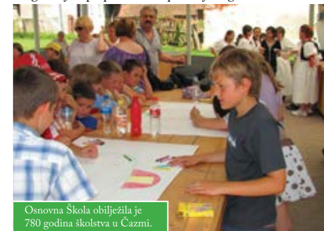
Osnovna škola obilježila je 780 godina školstva u Čazmi.

Program je upotpunio nastup Konjičkog kluba „Husar” iz