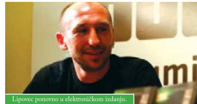
Lipovec ponovno u elektroničkom izdanju.

Društvo za promicanje književnosti na novim medijima (DPKM) objavilo u okviru projekta "Besplatne elektroničke knjige" ( www.elektronickeknjige.com ) zbirku pjesama "Rijeke i mjesečine" Slađana Lipovca.