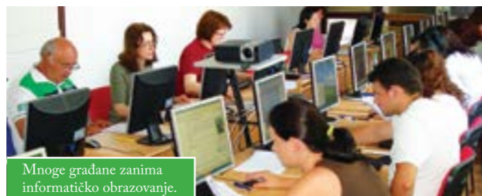
Mnoge građane zanima informatičko obrazovanje.

Završio je prvi dio programa za informatičko opismenjavanje građana koji su, uz potporu Grada Čazme i u organizaciji Centra za kulturu, proveli Centar za nove tehnologije i informacijsko društvo i CENTUS - Ustanova za obrazovanje odraslih. Sva tri stupnja osposobljavanja uspješno je završilo oko 140 polaznika. Najviše je interesa bilo za početni stupanj, a 30-ak osoba steklo je uvjerenja o osposobljenosti prema programu računalni operater, koje se upisuju u radnu knjižnicu. Program je namijenjen ponajprije obrazovanju nezaposlenih, poljoprivrednika i članova njihovih obitelji te su oni i činili većinu, no za informatičke tečajevе bili su zainteresirane i osobe koje žele promijeniti ili usavršiti posao. Grad Čazma sufinancirao je cijenu tečaja i u to je uloženo oko 40.000 kuna.