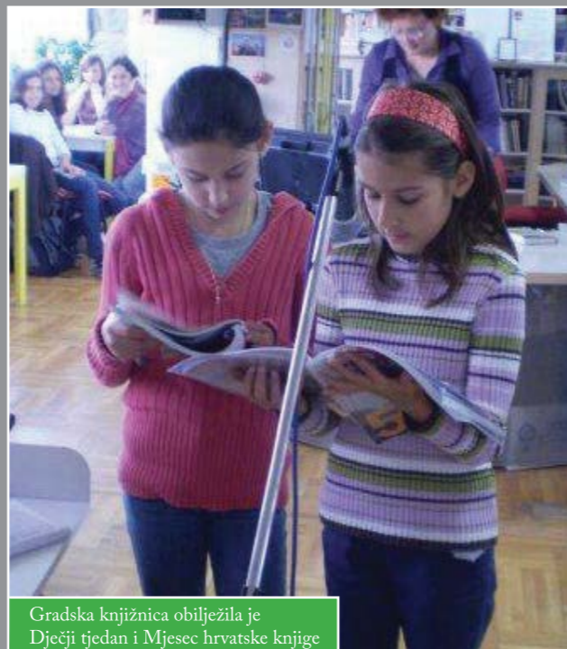
Gradska knjižnica obilježila je Dječji tjedan i Mjesec hrvatske knjige

Ideje vodilje ovogodišnjeg Dječjeg tjedna bile su: „Ljubav djeci prije svega“ i „Odrasli, slušajte nas!“.