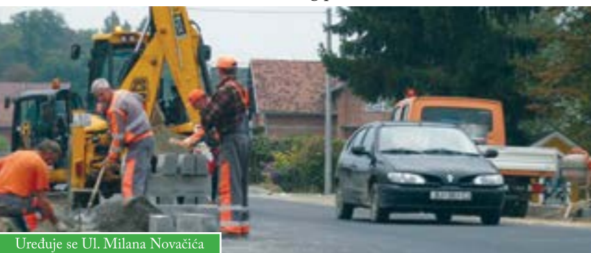
Uređuje se Ul. Milana Novačića

U tijeku je obnova ulice Milana Novačića u Čazmi. Asfaltira se 400m ceste s izradom slivnika i rubnjaka te dva nova ugibališta s jednim pješačkim prijelazom. Nastavljena je i izgradnja nogostupa u dužini od 700m, do skretanja prema draganečkim vinogradima. Radove većim dijelom financiraju Hrvatske ceste, uz potporu Grada Čazme i komunalnog poduzeća.