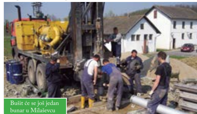
Bušit će se još jedan bunar u Milaševcu

dio zemljišta oko vodocrpilišta na kojem će bušiti novi bunar. Već su pripremili dokumentaciju vrijednu 150.000 kuna, i otkupili zemljište od privatnika.