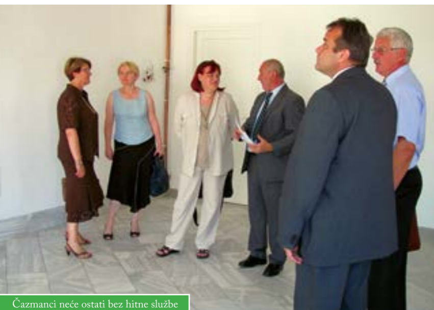
Čazmanci neće ostati bez hitne službe