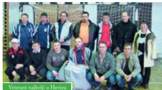
Veterani najbolji u Hevizu

U prijateljskom mađarskom gradu Hevizu održan je Prvi turnir u malom nogometu na kojemu je sudjelovala i ekipa iz Čazme. To je početak suradnje, odnosno povezivanje gradova Čazme, Heviza, Čakovca i još tri mađarska grada, koji zajednički kandidiraju projekt u europskom fondu IPA, za prekograničnu suradnju Mađarske i Hrvatske. Na malonogometnom turniru sudjelovalo je 6 ekipa. Veterani Čazme pokazali su se najspremnijima te su osvojili pobjednički pehar.