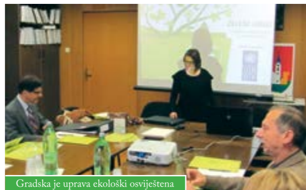
Gradska je uprava ekološki osviještena

Održana je edukacija za zaposlenike Uprave i Centra za kulturu Čazma u sklopu projekta "Zeleni ured". Taj pojam podrazumjeva prakticiranje svakodnevnih uredskih aktivnosti na način da se smanji negativan utjecaj na okoliš, a poveća efikasnost korištenja uredskih resursa. Svrha uvođenja zelenog ureda i zelenog poslovanja u javnu upravu je doprinos lokalnoj zajednici u primjeni načela održivog razvoja. Projekt provodi UNDP Hrvatska, uz potporu Ministarstva zaštite okoliša, prostornog uređenja i graditeljstva, Ministarstva gospodarstva, rada i poduzetništva te Fonda za zaštitu okoliša i energetske učinkovitost.