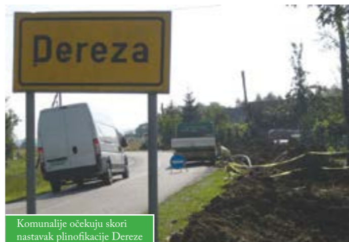
Komunalije očekuju skori nastavak plinifikacije Dereze

U Bosiljevu je izgrađen vodovod vrijedan oko 3 milijuna kuna. Ukupno će se izgraditi 4 km vodovoda, a dio je cijevi postavljen još lani. Nakon Bosiljeva, gradit će se i vodovod u Dapcima, a ukupna je vrijednost radova, koje financiraju Hrvatske vode, gotovo 6,5 milijuna kuna. U rebalansu Hrvatskih voda osigurano je 2,5 milijuna kuna za izgradnju vodovodnih pravaca Bosiljevo – Dapci i Milaševac – Pavličani, odnosno za dionice u Općevcu i Pobjeniku i rekonstrukciju vodocrpilišta Milaševac – za opremu novog bunara i obnovu pretrpno-mjerne stanice. Završetak gradnje vodovoda u Općevcu i Pobjeniku planiran je tijekom listopada. Neće se graditi vodovod u odvojcima tih naselja. Komunalije i Grad Čazma nastoje osigurati sredstva kako bi se mogao izgraditi vodovod do kraja Dabaca i Pavličana. Ukupna vrijednost tih vodovodnih sustava je 12 milijuna kuna, a njihovom izgradnjom vodoopskrbljenost čazmanskog područja povećat će se za 15% i iznositi će 65%, što je dvostruko više u odnosu na pokrivenost vodovodnom mrežom prije 5 godina.