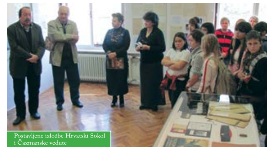
Postavljene izložbe Hrvatski Sokol i Čazmanske vedute