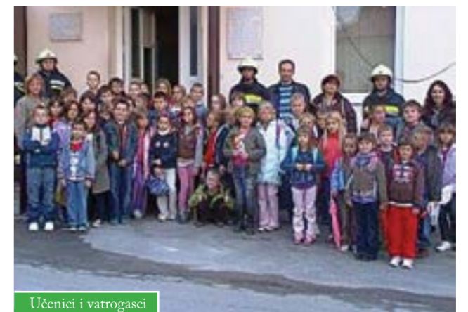
Učenici i vatrogasci

Učenici Osnovne škole Čazma, Područne škole Gornji Draganec, posjetili su Vatrogasni dom u Čazmi. Dočekali su ih zaposlenici JVP Grada Čazme i članovi DVD-a Čazma te ih upoznali sa zahtjevnim poslovima koje obavljaju vatrogasci.