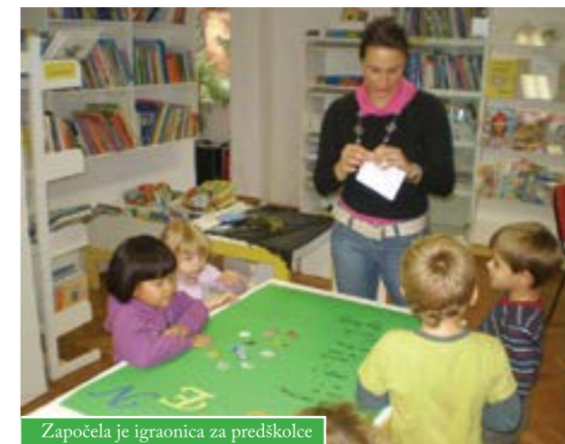
Započela je igraonica za predškolce

Gradska knjižnica Slavka Kolara Čazma organizira Igraonicu i pričaonicu za djecu predškolskog uzrasta, pod nazivom "Gdje knjige stanuju?".