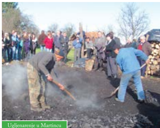
Ugljenarenje u Martincu

Održana je i misa u Kapeli sv. Martina u Martincu te krštenje mošta u vino, odnosno proslava Martinja.