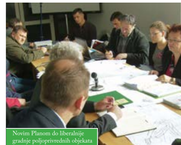
Novim Planom do liberalnije gradnje poljoprivrednih objekata

Održan je sastanak s poljoprivrednicima o prijedlogu Drugih Izmjena i dopuna Prostornog plana uređenja Grada Čazme. Izmjenom Plana trebala bi se omogućiti legalizacija postojećih poljoprivrednih objekata. Izgradnja novih i držanje stoke bit će moguće u svim čazmanskim naseljima 2. zone, odnosno u svim naseljima osim u Čazmi. Grad Čazma potiče razvoj poljoprivrede određenim