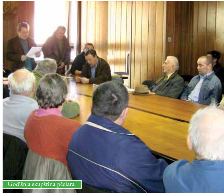
Godišnja skupština pčelara

Popis pčelinjaka, predavanja, predstavljanje proizvoda i korisnosti pčela učenicima Osnovne škole, darivanje meda vrtićancima te sudjelovanje na gradskim priredbama - supermaratonu, Danu Grada, Božićnom sajmu u Čazmi i Božićnom sajmu u Gudovcu, glavne su aktivnosti čazmanske Udruge pčelara u prošloj godini. Udruga ima 48 članova s područja bivše općine te susjedne Dubrave, Vrbovca i Križa, koji raspolažu sa 67 pčelinjaka i 1850 košnica.