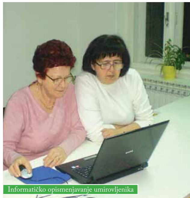
Informatičko opismenjavanje umirovljenika

U Gradskoj knjižnici Slavka Kolara Čazma, svakog ponedjeljka i petka održavaju se informatičke radionice za građane treće životne dobi.