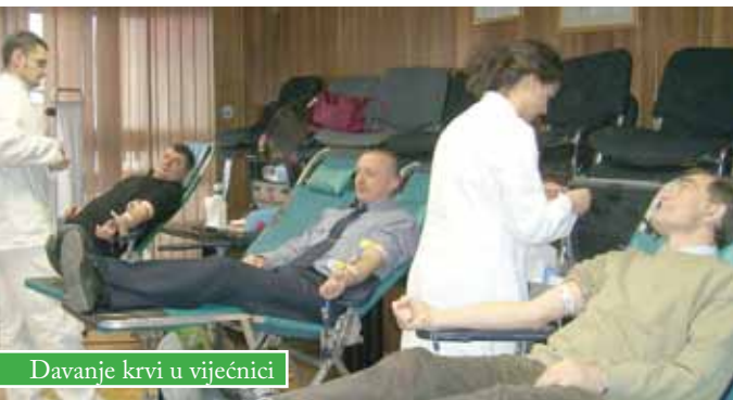
Davanje krvi u vijećnici

Gradsko društvo Crvenog križa Čazma provelo je još jednu akciju dobrovoljnog davanja krvi, među građanima, održanu u Gradskoj vijećnici, i, prvi put, u Srednjoj školi Čazma.