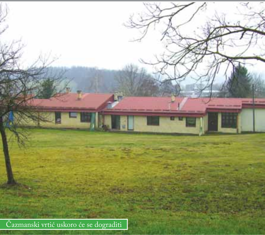
Čazmanski vrtić uskoro će se dograditi

Ovih je dana raspisan natječaj za dogradnju Dječjeg vrtića „Pčelica“ u Čazmi. Gradit će se višenamjenska dvorana, jasljece i prateće prostorije čime će se dobiti 250 četvornih metara dodatnog iskoristivog prostora. Na taj bi se način mogao povećati i broj upisane djece. Svakako će se poboljšati njihov boravak u vrtiću, posebice najmlađih, jasličke skupine, koja će konačno dobiti zadovoljavajući prostor. Novi će se dio zgrade nalaziti između postojećeg objekta i Doma zdravlja, a uz navedeno, gradit će se i pristupna cesta te parkiralište s desetak mjesta.