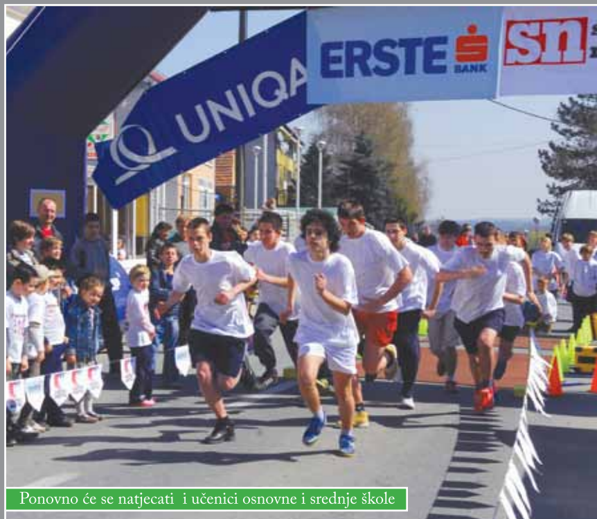
Ponovno će se natjecati i učenici osnovne i srednje škole

Zagrebačke županije, Grada Zagreba i Športskog saveza Bjelovarsko-bilogorske županije. Koliko je ova manifestacija važna i za razvoj turizma govori pokroviteljstvo o Hrvatske turističke zajednice, Turističke zajednice Bjelovarsko-bilogorske županije, Turističke zajednice Grada Zagreba i Turističke zajednice Grada Čazme.