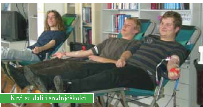
Krvi su dali i srednjoškolci

Krv je dalo 48-ero naših građana, među kojima 28 muškaraca i 20 žena. Osmero je novih davatelja, odnos je 6 naprama 2 u korist muškaraca.