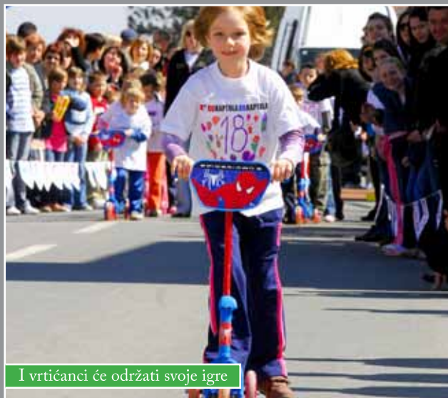
I vrtićanci će održati svoje igre

Zagrebačke županije, Grada Zagreba i Športskog saveza Bjelovarsko-bilogorske županije. Koliko je ova manifestacija važna i za razvoj turizma govori pokroviteljstvo o Hrvatske turističke zajednice, Turističke zajednice Bjelovarsko-bilogorske županije, Turističke zajednice Grada Zagreba i Turističke zajednice Grada Čazme.