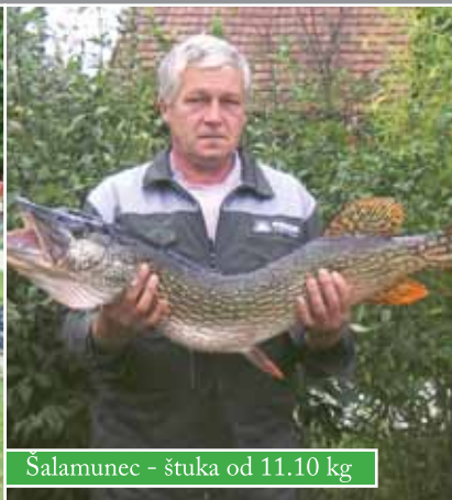
Šalamunec - štuka od 11.10 kg