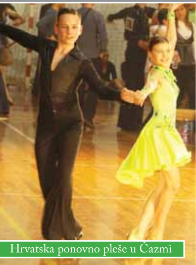
Hrvatska ponovno pleše u Čazmi

Već treću godinu Čazma ima čast biti domaćinom velikog plesnog spektakla u standardnim i latinsko-američkim plesovima pod nazivom “Hrvatska pleše u Čazmi”, za Trofej Grada Čazme i Bjelovarsko-bilogorske županije. Ovaj bodovni plesni turnir koji se održava 21. ožujka organizira Hrvatski sportsko plesni Savez i Sportsko plesni klub “H-8” iz Bjelovara, a jedan od pokrovitelja je Grad Čazma. Organizatori očekuju nastup više od 200 plesnih parova iz Hrvatske i susjednih zemalja. Natjecanje počinje u 12 sati u Školsko-sportskoj dvorani Osnovne škole u Čazmi, a finale i proglašenje pobjednika je u 19 sati. Sigurni smo da će hrvatska plesna elita i ove godine oduševiti čazmansku publiku kao što je to bilo i ranijih godina pred prepunom dvoranom.