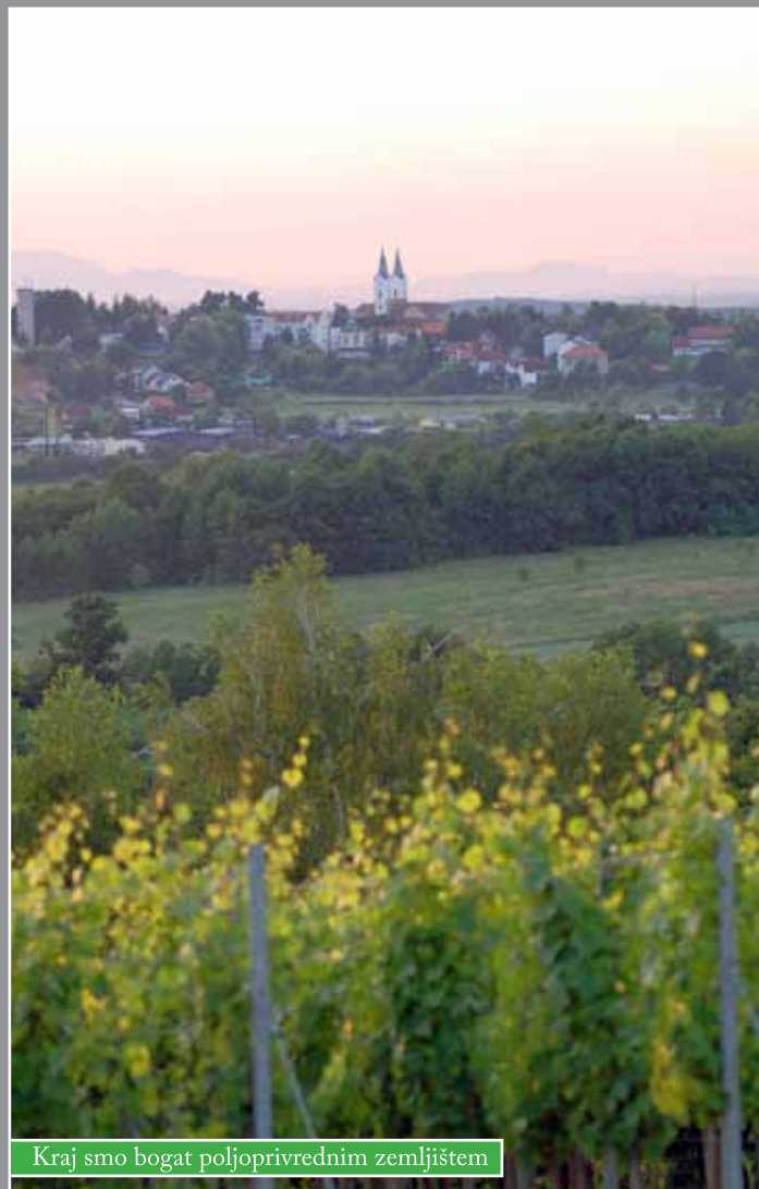
Kraj smo bogat poljoprivrednim zemljištem

Predstavnici Grada Čazme prezentirali su stanje poljoprivrednog zemljišta na tom području te ukazali na potrebu osnivanja ispostave buduće Agencije u Čazmi, radi učinkovitijeg rješavanja problematike privatnog poljoprivrednog zemljišta. Predstavnice Ureda za poljoprivredno zemljište u Bjelovarsko-bilogorskoj županiji održale su i predavanje za čazmanske poljoprivrednike u Gradskoj vijećnici te su sudjelovale i u emisiji o toj temi na Radiju Čazma.