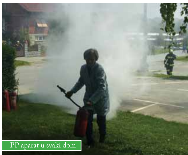
PP aparat u svaki dom

U povodu Mjeseca zaštite od požara u Čazmi će se provesti zajednička akcija Vatrogasne zajednice i Grada Čazme kojom će u konačnici svako domaćinstvo dobiti protupožarni aparat te se obučiti za njegovu uporabu. Namjera je unaprijediti vatrozaštitu ne našem području te smanjiti broj žrtava i količinu štete koja može nastati. Za početak, podijelit će se 60-ak protupožarnih aparata. Dobrovoljna vatrogasna društva bit će zadužena za njihovu kontrolu i obuku građana. Grad Čazma prvi je grad na širem području koji i na ovakav način nastoji doprinjeti smanjenju opasnosti od požara.