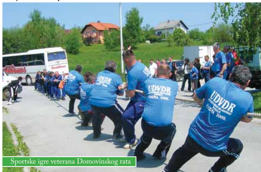
Sportske igre veterana Domovinskog rata

Natjecanja su se održala u osam disciplina: stolni tenis, boćanje, mali nogomet, povlačenje užeta, kuglanje, streljaštvo, šah i pikado.