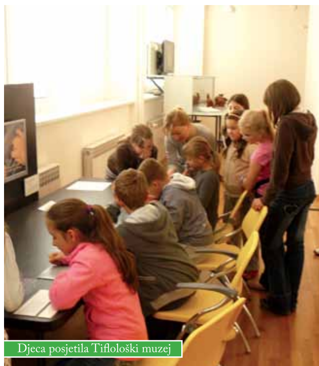
Djeca posjetila Tiflološki muzej