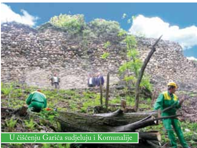
U čišćenju Garića sudjeluju i Komunalije

U povodu Dana planeta Zemlje, bjelovarsko – bilogorski župan Miroslav Čaćija sa suradnicima te gradonačelnici Čazme, Kutine i Garešnice i ostali uključeni u projekt obnove Garić – Grada posjetili su tu povijesnu utvrdu. Podsjetimo, potkraj prošle godine oživljena je suradnja gradova i općina na ovom projektu te je postavljena i interpretacijska tabla s kratkom poviješću Garića na hrvatskom i engleskom jeziku. U međuvremenu su utvrđeni sljedeći poslovi, među kojima uređenje okoliša koji dijelom odrađuju i čazmanske Komunalije. Obnova središnje kule trebala bi početi nagodinu.