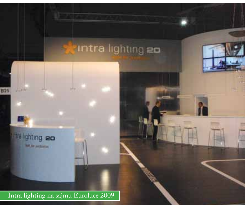
Intra lighting na sajmu EuroLuce 2009

U Čazmi godinama uspješno posluje tvrtka Intra lighting, koja se bavi proizvodnjom svjetiljaka za unutrašnju rasvjetu. Pogon preuzet od tvrtke TEP obnovljen je i znatno unaprijeđen. Danas je to tvrtka svjetskoga imena, koja planira proširiti proizvodne kapacitete i zaposliti nove ljude. Intra lighting iz Čazme dio je međunarodne grupacije koja ima visoki status u europskim i svjetskim razmjerima. Centrala grupacije se nalazi u Mirenu (pokraj Nove Gorice u Sloveniji), a uz Čazmu, proizvodnja se nalazi i u Donjem Milanovcu, u Srbiji. Svojim zastupnicima ili predstavništvima, Intra lighting pokriva više od 30 europskih zemalja, a prisutna je u Torontu, Singapuru, Perthu i Dubaiju. Intra lighting d.o.o. je i ove godine pokazala svoju visoku kvalitetu kao i renome na europskoj i svjetskoj razini, sudjelovanjem na sajmu EuroLuce 2009, u Milanu. Tom su prilikom ostvarili brojne nove poslovne kontakte i time osigurali budućnost tvrtke. Da se radi o tvrtki u koju se isplati ulagati, pokazala je i Europska unija, koja je financijski znatno pomogla sudjelovanje na sajmu.