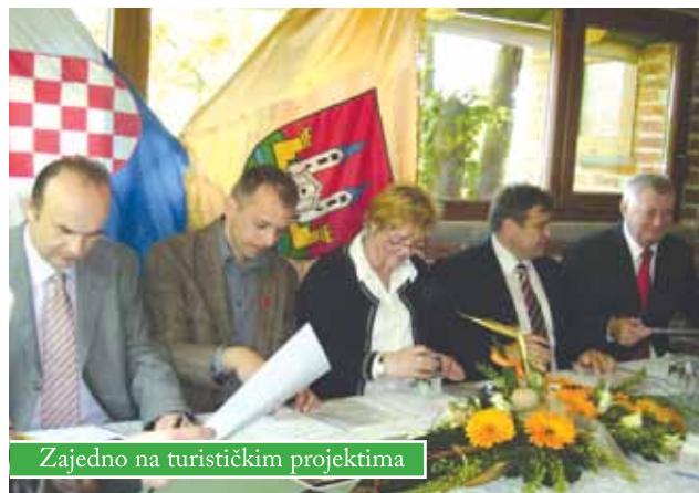
Zajedno na turističkim projektima

Potpisivanju su prisustvovali gradonačelnici Čazme, Garešnice i Kutine, načelnici nekoliko moslavačkih općina, direktori i predsjednici turističkih zajednica moslavačkih gradova i općina, direktori dviju županijskih turističkih zajednica, ravnateljica Muzeja Moslavine, te predsjednici udruga koje surađuju na projektima.