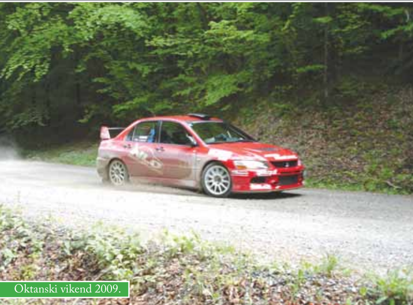
Oktanski vikend 2009.

Nakon prošle sezone i ORC relija u Čazmi, ove je godine održan oktanski vikend. Na kraju prvog dana Oktanskog vikenda proglašeni su pobjednici natjecanja u izgledu automobila. Na Trgu čazmanskog kaptola ljepotane je detaljno pregledavala stručna komisija i za najljepši proglasila VW Golf Darka Severa.