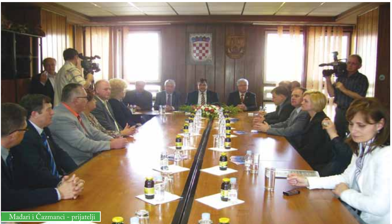
Mađari i Čazmanci - prijatelji