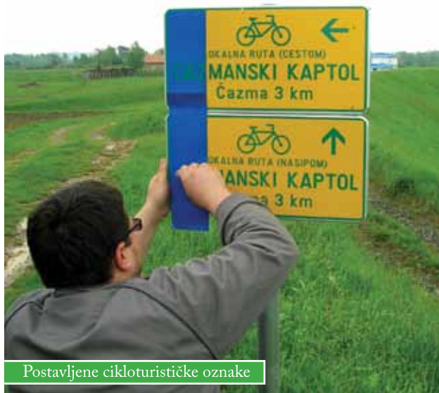
Postavljene cikloturističke oznake

Uoči Dana planeta Zemlje završeno je označavanje prve lokalne biciklističke rute «Čazmanski kaptol», od ukupno tri koje je osmislila Turistička zajednica Grada Čazme po projektu «Oko Čazmanskog kaptola», namijenjene cikloturistima. Prva ruta duga je 36 km i na njoj cikloturisti mogu uživati u vožnji biciklima kroz naselja, uz marčanske vinograde, kroz šumu, uz rijeke Glogovnicu i Česmu te upoznati kulturno – povijesnu tradiciju našega kraja. Viciklistički prvijenac označen je na relaciji Čazma – Cerina – Grabik – Prnjarovac – Marčani – Sovari – Dapci – Matatinka – Bosiljevo – Proključani – Dereza – Čazma.