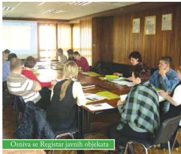
Osniva se Registar javnih objekata

Rezultat prikupljanja podataka za Registar bit će detaljan i sustavan popis svih objekata koji su u vlasništvu Grada Čazma i Grubišno polje. Nakon što se prikupe podaci, pristupit će se energetske pregledima zgrada koji će dati prijedloge mjera za poboljšanje energetske učinkovitosti te obnove objekata.