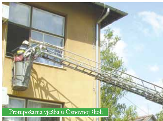
Protupožarna vježba u Osnovnoj školi

Na inicijativu Područnog ureda za zaštitu i spašavanje iz Bjelovara, u Čazmi se održala vježba evakuacije, spašavanja i gašenja požara. Vježbu su organizirali Javna vatrogasna postrojba Grada Čazme, Stožer zaštite i spašavanja Grada Čazme i Osnovna škola Čazma, a sudjelovali su i Hidroregulacija, HEP, Dom zdravlja Čazma, DVD Čazma, Komunalije Čazma, Županijski centar 112, ekipa mladeži Crvenog križa i drugi.