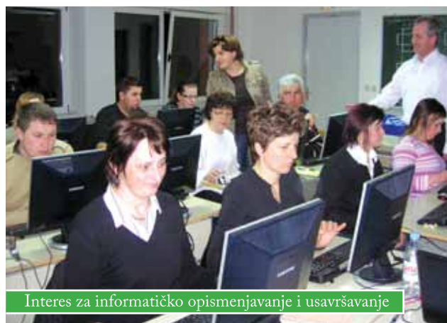
Interes za informatičko opismenjavanje i usavršavanje

Ukupno 35 polaznika uspješno je završilo tečaj osnovnih informatičkih vještina za rad na računalu, a 15 se predbilježilo i za napredni tečaj. Osnovni tečaj ponovno će početi polovicom listopada, a građani će, putem javnih medija i obavijesti, saznati ukoliko će tijekom ljeta biti kraćih, odnosno ciljanih radionica (primjerice, za rad u Microsoft Powerpointu, Excelu ili sl.). Informatički tečajevi održavaju se u prostorijama Srednje škole Čazma, a s 30.000 kuna sufinancira ih Grad Čazma.