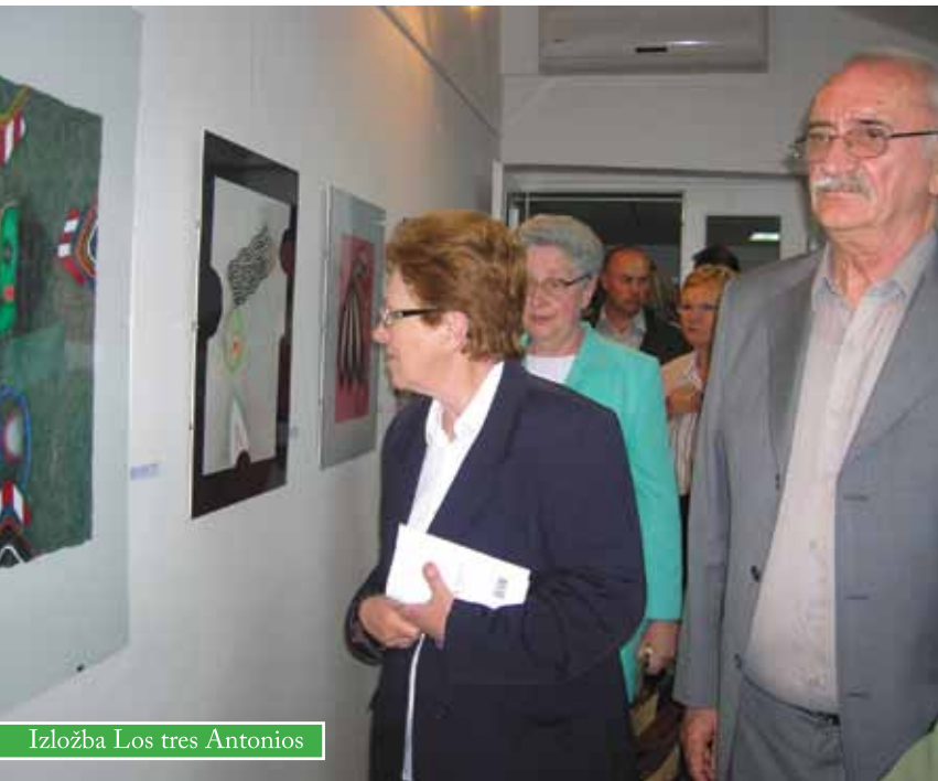
Izložba Los tres Antonios

U Centru za kulturu u Čazmi otvorena je izložba «Los tres Antonios». Izloženi su radovi Antona Cetina, Antonia Diaza Corteza i Antonia Galveza.