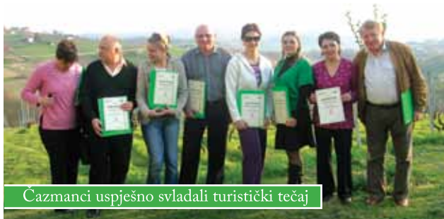
Čazmanci uspješno svladali turistički tečaj

Predstavnica Ministarstva turizma najavila je i seminar „Obrazovanje za turizam na seljačkim gospodarstvima i ruralni turizam“ koji se održao u Bjelovarsko – bilogorskoj županiji i na kojemu je sudjelovalo petnaestak Čazmanaca.