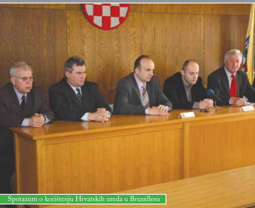
Sporazum o korištenju Hrvatskih ureda u Bruxellesu

Nakon sklopljenog sporazuma o suradnji između gradova Kutine, Garešnice i Čazme, „1 u 3 i 3 u 1”, o zajedničkom interesu u realizaciji projekta na području mikroregije Moslavina, u Garešnici je potpisan sporazum o korištenju Ureda hrvatskih regija u Bruxellesu među navedenim gradovima i Varaždinskom razvojnom