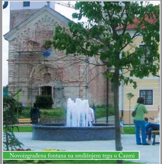
Novoizgrađena fontana na središnjem trgu u Čazmi

Središte Čazme, uz prije izgrađeni park sa spomenikom braniteljima stradalima u Domovinskom ratu, sada je potpuno uređeno.