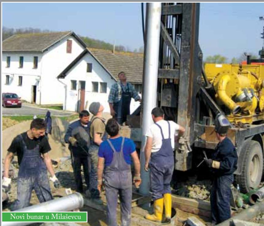
Novi bunar u Milaševcu

Ulaganja u vodovodnu mrežu u 2008. godini za distribuciju Čazme Komunalije su stajala 2.600.000 kuna, što je uloženo u vodovod u Grabovnici te projektiranje vodovodnih pravaca Milaševac – Pavličani i Bosiljevo – Dapci.